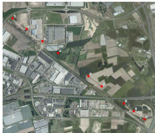
Windpark Greenport Venlo, huidig plan

Wat hier gebeurt, is dat men net doet alsof hier Windpark Greenport Venlo vergeleken wordt met andere locaties. DAT IS ECHTER HELEMAAL NIET HET GEVAL, er is geen sprake van het nu aan de orde zijnde plan van 9 windturbines. Er is slechts sprake van het deel van het voorkeursgebied van het POL2014 waar de 4 windturbines gepland zijn waarmee wij kunnen leven.